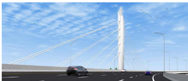
Le pont du canal de Lachine

Enfin, dans le secteur Sud du projet, l'entrepreneur construira la nouvelle sortie menant de l'autoroute 15 en direction nord au boulevard De La Vérendrye. Celle-ci devrait être en service au cours de l'été 2016. Débutée en février, la construction des fondations du futur pont du canal de Lachine se poursuit du côté sud du canal. Par la suite, les équipes procéderont à la construction des colonnes, des chevêtres et des culées. Au cours des prochains mois, la construction des éléments de fondation du pont situés du côté nord du canal commencera également.