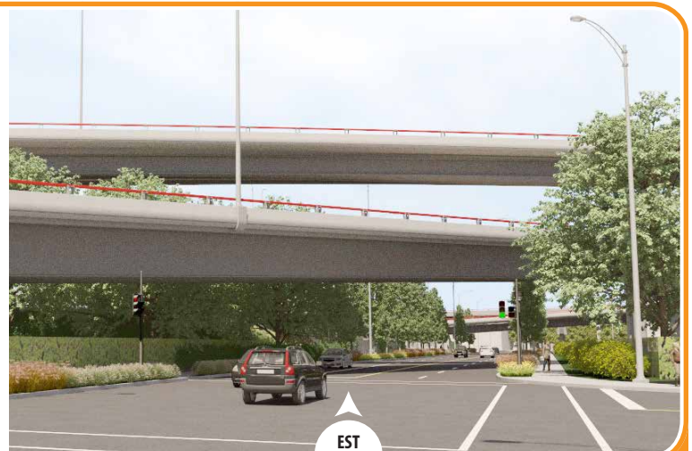
Arbres, arbustes et plantes grimpantes*