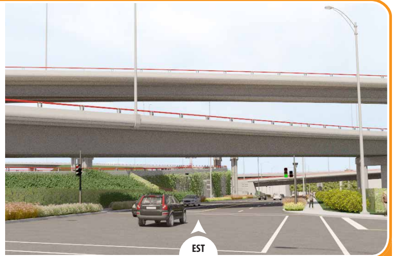
Arbustes et plantes grimpantes*