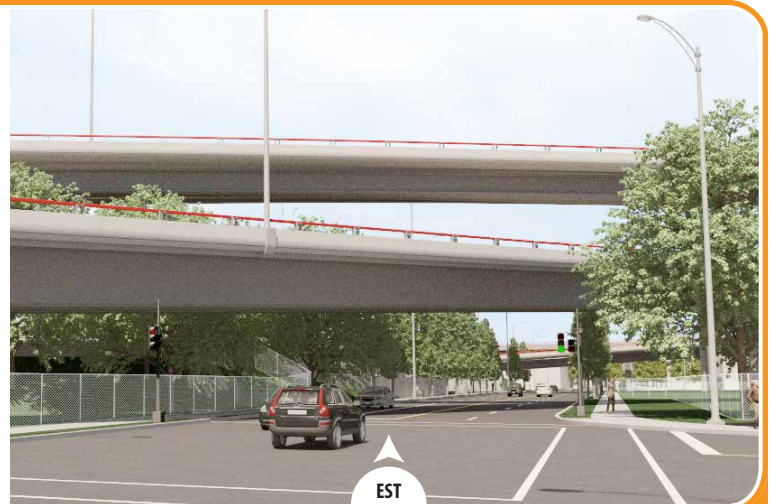
Arbres et gazonnement*